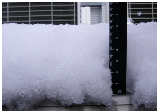
降り積もった雪の上層を解析する。

高山に生育している生物がつくばで見つかる！？と言っても、それは地衣類に共生している微細な藻類でした。その一方、つくばで熱帯性の地衣類を見つけることもありました。私が研究材料としているのは菌類と藻類から成り立っている共生体の「地衣類」という生きものです。2つの生物がセットでないと生きられない地衣類が、どうやら随分と長距離を移動して繁殖することもあるようなのです。地衣類の増え方には大きく分けて二つあります。一つは菌類が作る孢子が飛散し、たどり着いた先で、パートナーとなる藻類に出会って再び地衣類になるというもの。もう一つは、はじめから菌と藻が一緒になった特別な散布体が作られて、それが飛んでいった先で再生するというもの。これまで、演者らは地衣類の長距離移動の秘密に迫るべく、大気中に浮遊している微細な藻類や菌類の解析などをしてきました。それらの研究では、上空からゆっくりと大気中の浮遊物を付着させて降下してくる「雪」に着目しました。きれいに見える白い雪もフィルターで濾してみると緑や茶色、黒っぽい色になってしまい、様々な微生物が含まれていることが分かります。本講演では、雪の解析やこれまでに様々な地域でおこなってきた地衣類研究の紹介を通して、空から地上へと微小な生物たちが、実はどっぴりと降り注いでいることを知っていただければ幸いです。