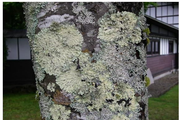
多様な地衣類はどこからやってくるのか？