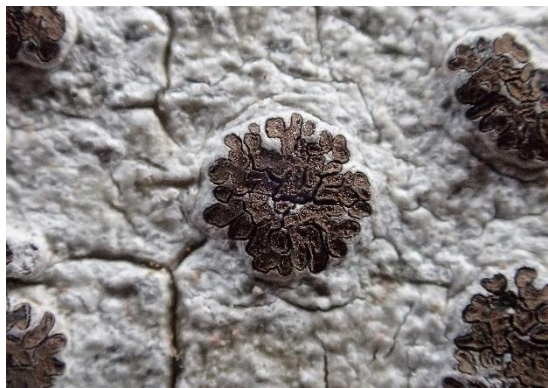
つくばで見つかった熱帯性のアミモジゴケ。