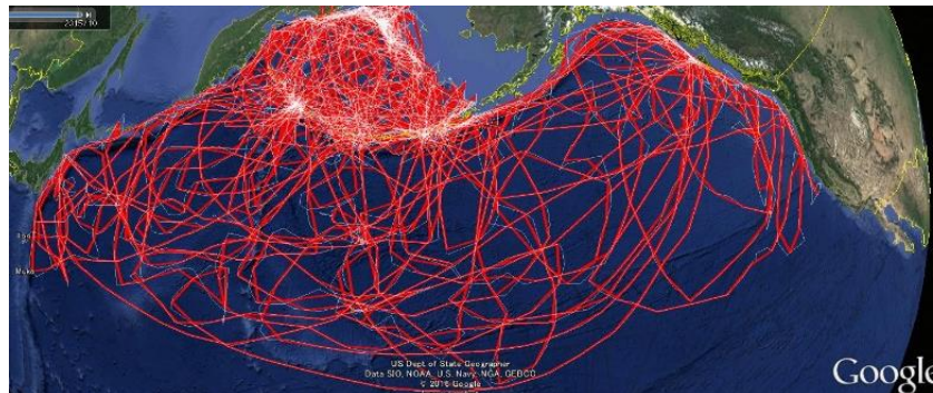
アホウドリ（左）の人工衛星による5年間の追跡結果（上）