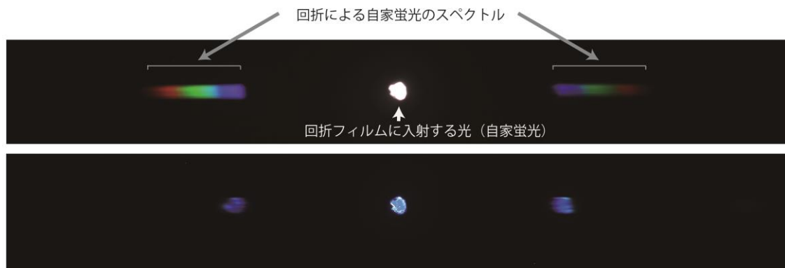
図2. 上: Glyphiteuthis libanotica (i24801) における外套膜部位の自家蛍光 (乳白色) のスペクトル像. 下: 同様の撮影セッティングにおける可視光 (505nm) の回折スペクトル像.