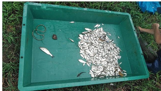
百合ヶ浜沖の大網 大量のコノシロ