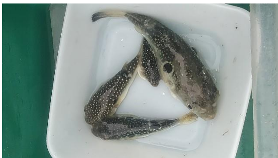
初記録のトラフグ(右上と下)