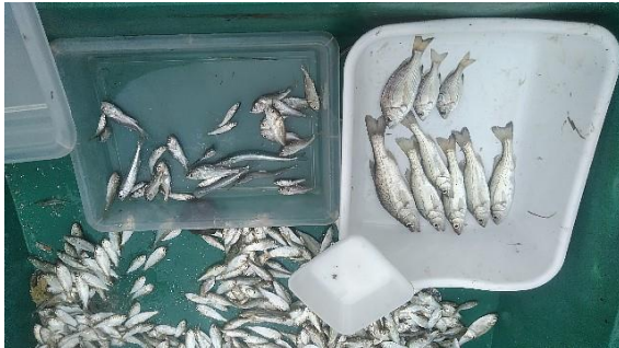
百合ヶ浜大網 スズキやサヨリなど