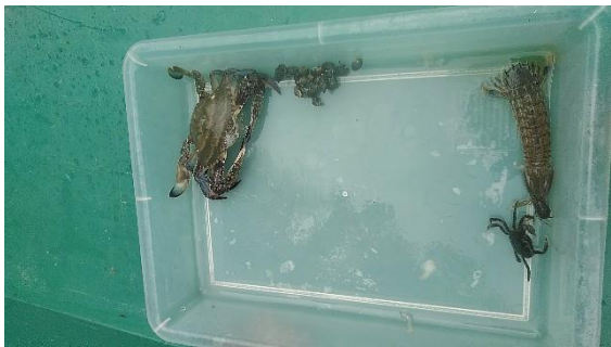
ガザミ(左上) シャコ(右上)